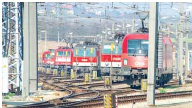
Die Bahn ist bereit für den integrierten Takt

ihnen die Todesstrafe. In dem neunstöckigen Gebäude arbeiteten bis zu 5.000 Menschen. Bemühungen zur Verbesserung der Arbeitsbedingungen greifen nur sehr langsam. http://bangladeshaccord.org/ HO