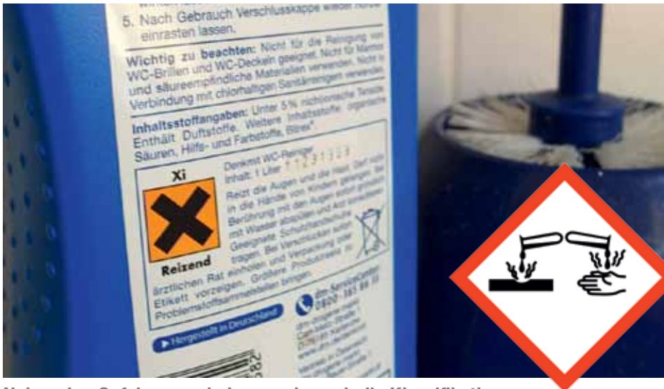
Neben den Gefahrensymbolen wurde auch die Klassifikation der Gefahren verändert