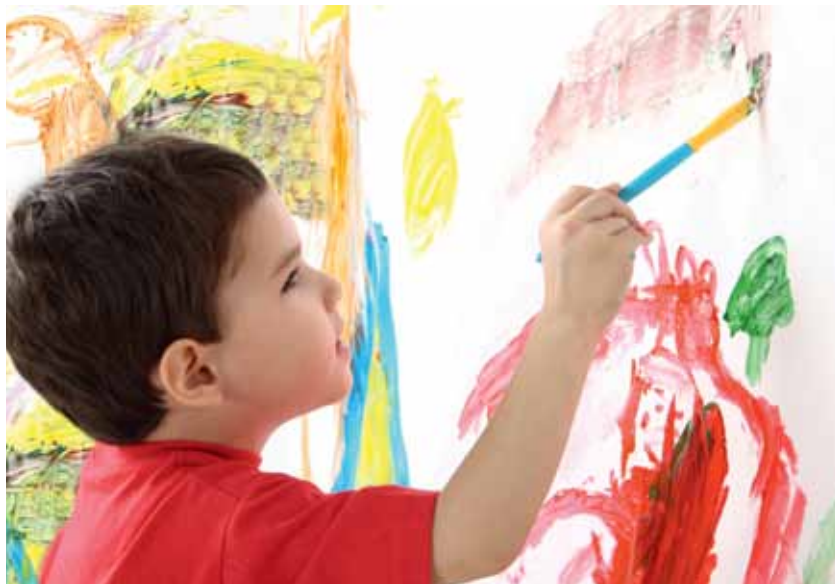
Förderung von Phantasie und Talenten ist Teil eines guten Lebens

Das gute Leben steht damit in einem Zusammenhang mit ähnlichen Vorstellungen einer erstrebenswerten Zukunft, wie sie von der – stärker akademisch verankerten – Postwachstumsbewegung oder den ProponentInnen einer sozial-ökologischen Transformation vertreten werden. Der Reiz der Diskussion ist, dass sie nicht primär vor den biophysikalischen Grenzen unserer Lebensweise warnt, sondern die Erfüllung menschlicher Bedürfnisse ins Zentrum rückt. Damit grenzt sie sich auch von der Diskussion zu „Green Growth“ ab, die zur Entschärfung der ökologischen Krise auf eine Erhöhung der Ressourcenproduktivität durch technologische Innovation setzt, aber die sozialen Voraussetzungen unserer Produktions- und Wirtschaftsweise kaum thematisiert. Der Diskurs zum guten Leben entwirft Bilder einer solidarischen Gesellschaft, in der das vorrangige Ziel der Politik die