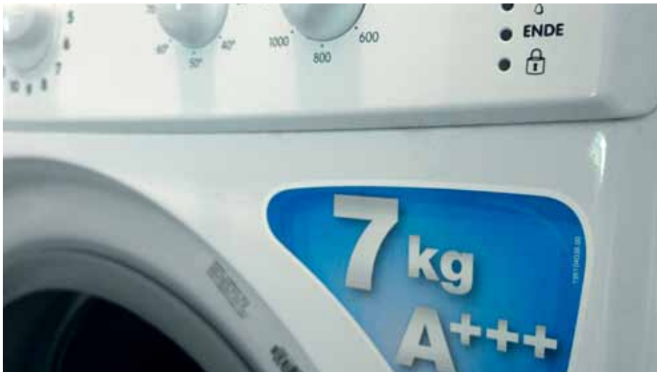
Neue Haushaltsgeräte: Auf Angebote der Energielieferanten achten!