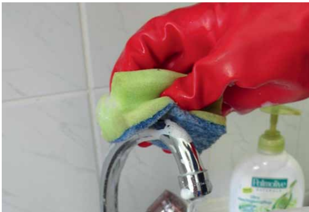
Auch ArbeitnehmerInnen müssen auf die neuen Symbole achten

Zu jeder der genannten Gefahrenklassen enthält die CLP-Verordnung nicht nur genaue Bestimmungen, unter welchen Umständen Stoffe und Gemische zu dieser Gefahrenklasse