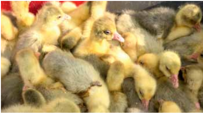
Auch männliche Küken sollen aufwachsen dürfen

Überschreitungen) und die noch ausstehenden Wintermonate scheinen aber die Probleme nur vorerst ausgeräumt. Dagegen steht Österreich bei der Richtlinie über nationale Emissionshöchstmenge für bestimmte Luftschadstoffe mit dem Rücken zur Wand. Grund: Österreich verfehlt auch vier Jahre nach dem eigentlichen Erfüllungsdatum die EU-Vorgaben bei Stickstoffoxiden mehr als deutlich. Laut gut informierten Quellen prüfte die EU-Kommission ernsthaft ein Verfahren. FG