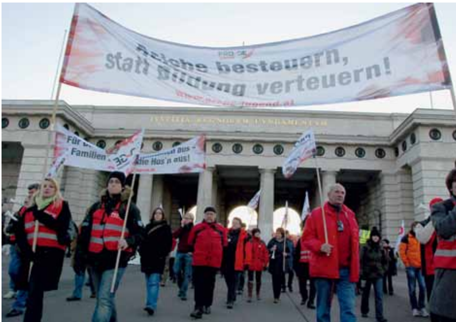
Eine gerechte Vermögensbesteuerung ist längst überfällig