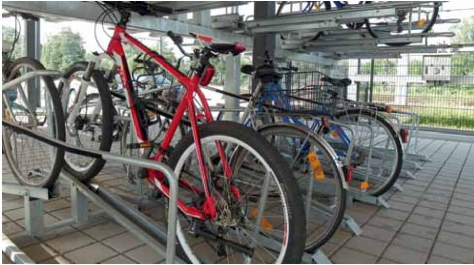
Rund 17.300 Fahrrad-Stellplätze fehlen an den Bahnhöfen und Haltestellen