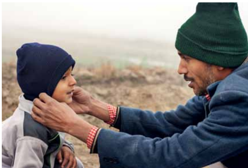
Die Bedürfnisse der Menschen stehen im Mittelpunkt

Damit kommen wir zu einem Kernelement der Forderung nach einem guten Leben für alle. Es bedarf Formen des individuellen und gesellschaftlichen Wohlstands, die auf politische Gestaltung, sozial-ökologisch verträgliche Produktion und ein attraktives Leben für die Menschen setzen: Die destabilisierenden Formen des kapitalistischen Wachstums und die damit verbundenen Interessen müssen verändert werden. Damit werden gesellschaftliche Bedingungen möglich, unter denen Menschen ihre Individualität entfalten und leben können – und zwar in einem solidarischen sozialen Zusammenhang, der ja erst die Bedingung freier Persönlichkeitsentwicklung ist.