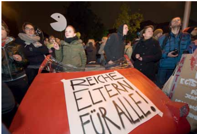
Chancengleichheit – auch in der Bildung

Arbeitszeitverkürzung schafft Lebensqualität. Zunehmend regt sich Widerstand gegen die voranschreitende „Ökonomisierung“ unseres gesamten Lebens. Durch eine generelle Arbeitszeitverkürzung wird sich diese gesellschaftliche Entwicklung zwar nicht aufhalten lassen, es wird jedoch die Möglichkeit zu einer ausgewogenen Priorisierung geschaffen. Unabhängig davon, ob es hier um die Familie, FreundInnen, Weiterbildung, zivilgesellschaftliches