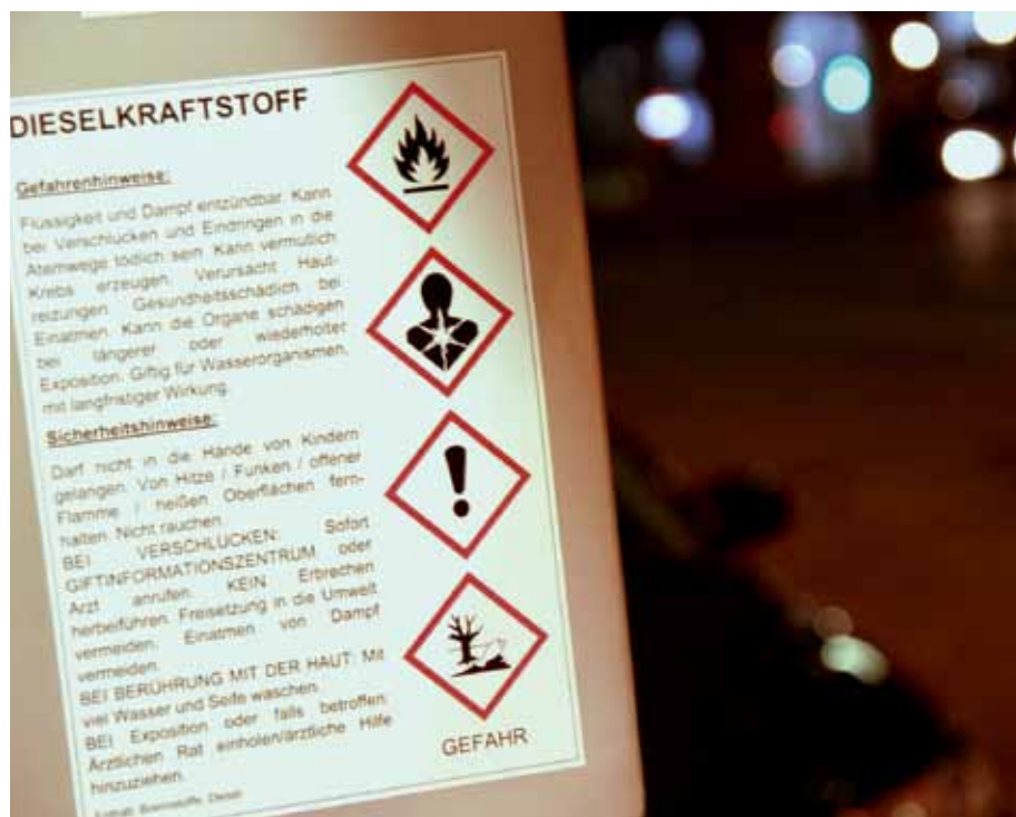
Neue Kennzeichnung an Tankstellen auch für Diesel

Die physikalischen Gefahren durch Chemikalien werden in 16 Klassen eingeteilt, die gesundheitlichen in zehn und die Gefahren für die Umwelt in zwei.